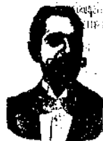
A. Salvati-Costanzi Inventore

pei medicinali Salvati-Costanzi , ritenuti una vera panacea per tutti i mali genito-urinari. E difatti, basta consultare l' interessantissimo opuscolo tascabile che si spedisce gratis dietro richiesta, per rimanere sbalorditi nell'apprendere come coll'uso di semplici confetti che hanno la virtù di distruggere le calcolosità che si formano nell'uretra, ciò che impe-