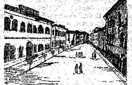
Via Vittorio Emanuele del Lemene, dappresso al suo castello vescovile, perchè vi costruisse un porto e vi edificasse le abitazioni.

Nell'anno 1140 Gervino Vescovo di Concordia concesse ad una società di portolani delle venete lagune una vasta zona di territorio, sulla sponda sinistra