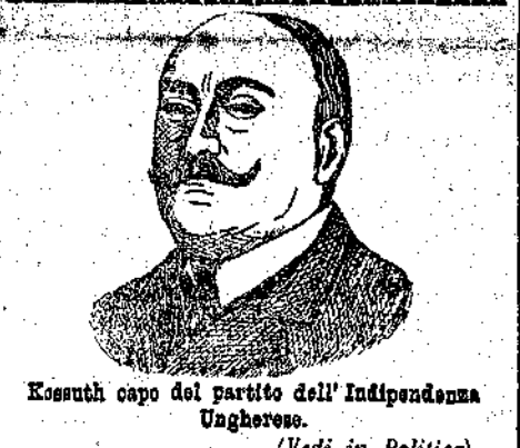
Kossuth capo del partito dell'Indipendenza Ungherese. (Vedi in Politica).