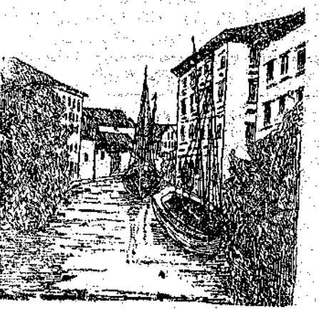
La dogana. desta che in se concentrava l'autorità giudiziaria ed amministrativa.

Fattosi più grosso e popolato il Comune, aumentato il movimento del commercio e del porto, non fu più possibile attendere il placito per la decisione delle controversie e, sull'esempio dei maggiori centri, si incominciò ad eleggere il Po-