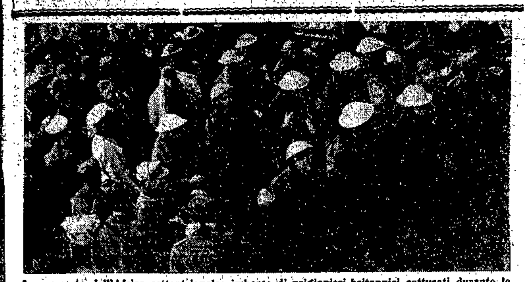
In un porto dell'Africa settentrionale: imbarco di prigionieri britannici catturati durante le ultime operazioni.