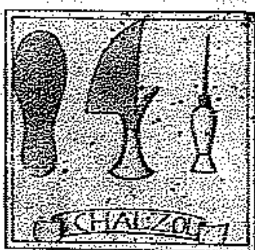
Steme dai Cjaliars di Orvieto

Jo 'o dirès di no, parceche chest predi al veve cjase in Bore di Puinç, mentrè che il stranzèt al è in Bore di San Pieri e al mostre di sêi dal quatri o dal cincocent.