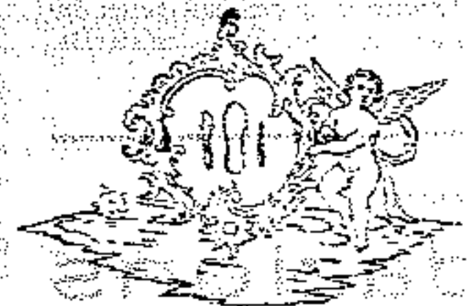
Un'altre steme dai Cjaliars di Udin (1780)

Al nus scrif ançe, il nestri Peri, che a Cividât al fo mans'onari,