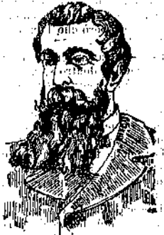
DOPO LA CURA