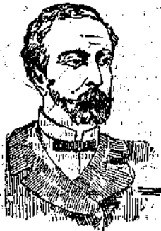
PRIMA DELLA CURA