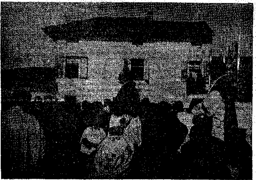
S. E. Mons. Arcivescovo di Udine e S. Maria La Longa parla alla presenza di generali, ai militari ed ai borghesi

VELIVOLI NEMICI LANCIARONO IERI ALCUNE BOMBE IN VALLE LAGARINA E IN CARNIA; QUALCHE VITTIMA E LIEVI DANNI, STAMANE, DURANTE UNA INCURSIONE AEREA SU